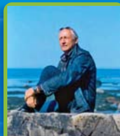
Sous la présidence d'honneur de l'explorateur Bernard Voyer, o.c., c.q.

Soumets un travail de session ou un projet qui traite d'une problématique environnementale